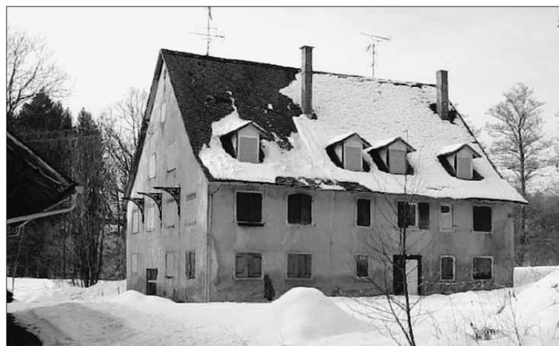
Die Reste der ehemaligen Goldschmiedsmühle im Achbogen südlich von Oberreitnau, deren Geschichte bis in das Jahr 1356 zurück belegt werden kann. Hier hat vor knapp 250 Jahren eine Frau gewohnt, die in der Sonntagsmesse einen Skandal vom Zaun gebrochen hat.